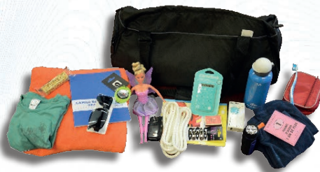
Jeu du kit d'urgence

Pour la seconde partie, les enfants sont mobilisés en petits groupes. Ils doivent réaliser un kit de survie en cas d'inondation. L'objectif de cet exercice ludique est de connaître quels sont les objets à garder avec soi de façon prioritaire en cas de crue soudaine et les bons réflexes à adopter.